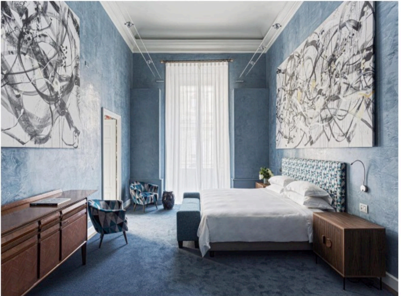
Galleria Vik Hotel, Milano

S tiamo parlando del Galleria Vik Milano , un luogo d'arte nell'arte concepito come una mostra collettiva che si estende per tutti i cinque piani dell'hotel. I corridoi, trasformati in gallerie d'arte, ospitano opere immersive accanto a mobili contemporanei e antichi.