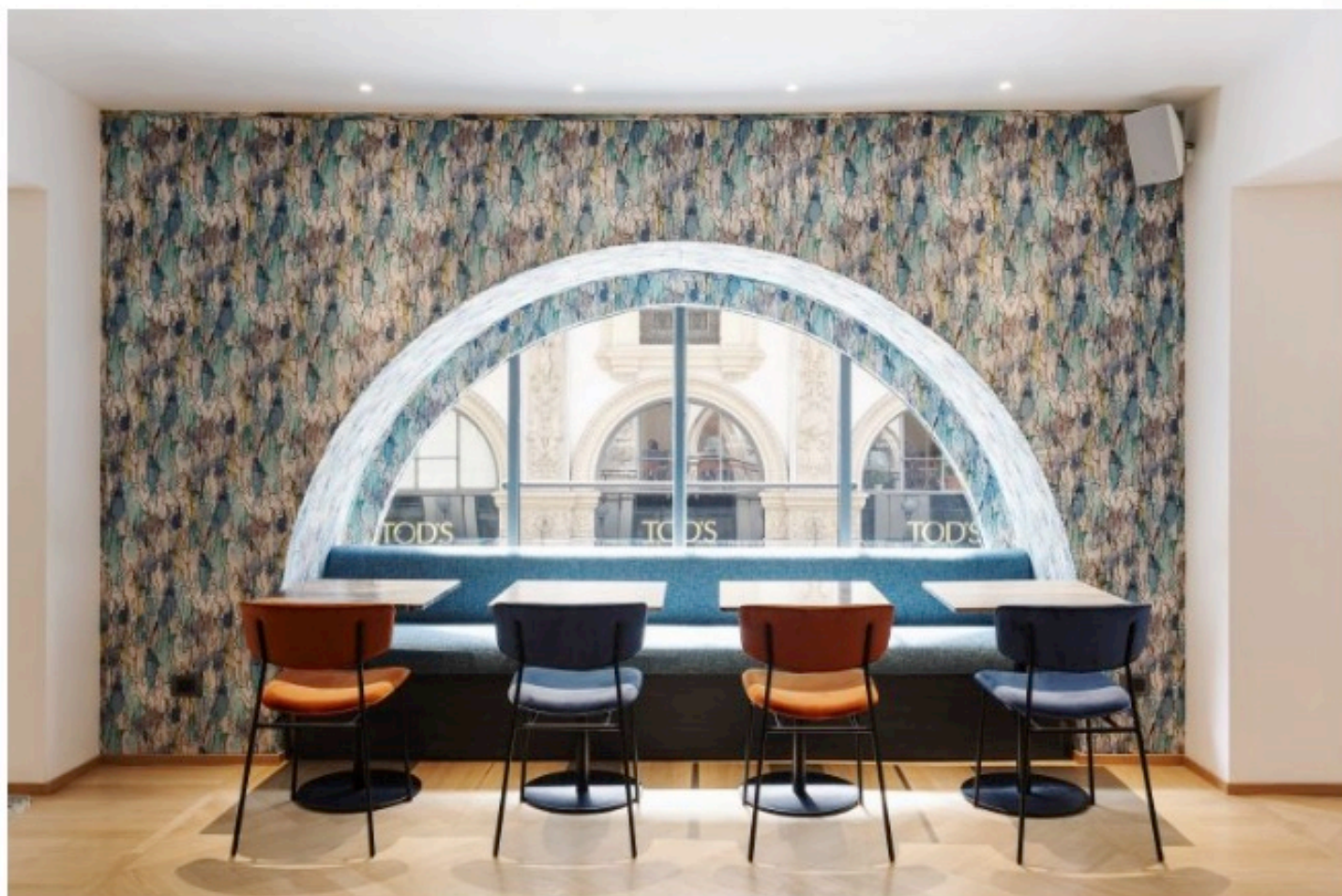
Galleria Vik Hotel, Milano

Al primo piano dell'hotel si trova il ristorante Vikissimo con vista Galleria Vittorio Emanuele II. Aperto tutti i giorni dalla colazione al dopocena, offre un menù disegnato dallo chef uruguayano German Bentancur che mixa ispirazioni sudamericane con la cucina italiana.