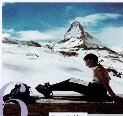
Uno scatto del 1950 di Robert Capa a Zermatt, in Svizzera.

Un prezioso e colorato portacandele in vetro di murano e ottone: nella collezione Past & Future di Veronese (con design di Piet Hein Eek) oggetti semplici diventano barocchi, intriganti e sostenibili: i suoi fregi danno una colorata seconda vita al vetro soffiato ( veronese.fi ).